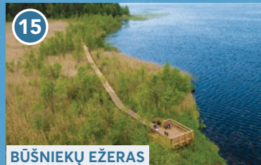
15 BŪŠNIEKŪ EŽERAS