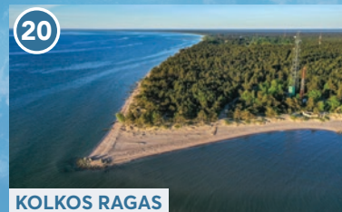
20 KOLKOS RAGAS

Susipažinkite su maršrutu žingsnis po žingsnio