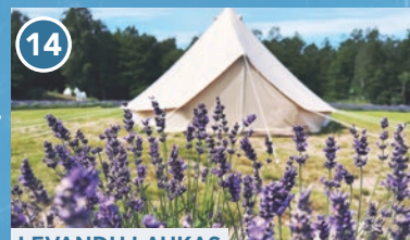
14 LEVANDŪ LAUKAS HOUSE OF LAVENDER (liepos – rugsėjo mėn.)