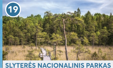
19 SLYTERĒS NACIONALINIS PARKAS