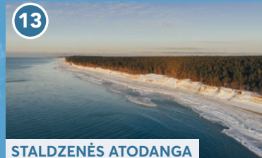
13 STALDZENĒS ATODANGA