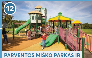
12 PARVENTOS MIŠKO PARKAS IR VAIKŪ PARKAS „FANTAZIJA“