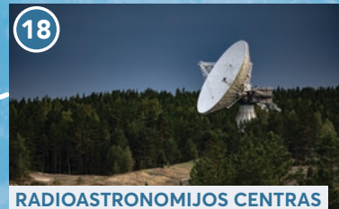
18 RADIOASTRONOMIJOS CENTRAS IRBENĒJE