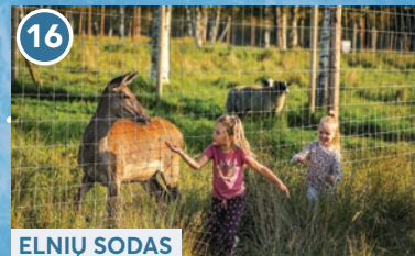
16 ELNĪŪ SODAS