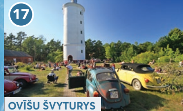
17 OVĪŠU ŠVYTURYS