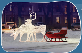
9. JAUNPILSĒTAS LAUKUMS Mirdzošs briežu pāris ar ragavām.