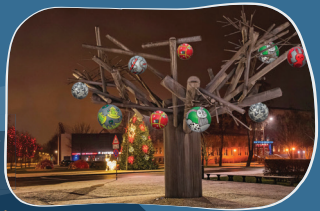
13. PĀRVENTAS CENTRS Galvenā labā krasta egle Ziemassvētku egle un strūklaka "Kāpu priede", izrotāta ar 12 lielām bumbām.