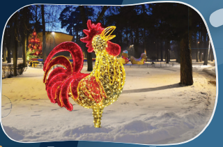
7. BĒRNU PILSĒTĪNA Austrumu horoskopa figūras un zvaigžņota Ziemassvētku egle.