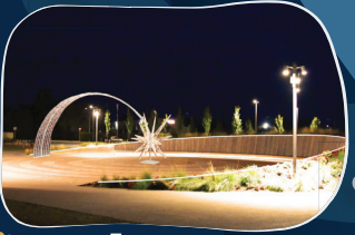
12. ZINĀTNES CENTRS "VIZIUM" "Krītošas zvaigznes gaismas arka".