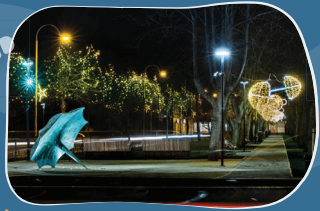
6. LAIKKRAKSTU ALEJA Izgaismota lietussargu kompozīcija.