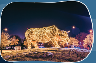
11. SARKANMUIŽAS PLAVA Ziedu skulptūra "Puku govs" mirdzošā ziemas noformējumā.