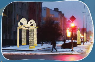
10. LIELAIS PROSPEKTS Izgaismotas lielizmēra sveces un dāvanu kaste.