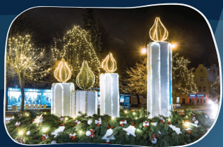
4. KULDĪGAS UN GANĪBU IELAS Siena tirgus laukumā Adventes vainaģa ik nedēļu līdz Ziemassvētkiem iedegas pa vienai svecei.