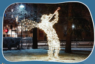
5. DZIRNAVU LAUKUMS Muzicējoši engeliši.