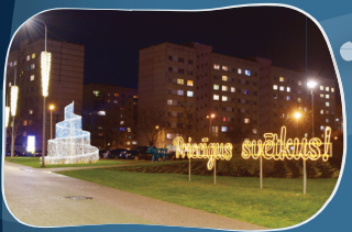
8. INŽENIERU IELA Stilizēti gaismas objekti.