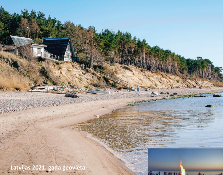
Latvijas 2021. gada ģeovieta