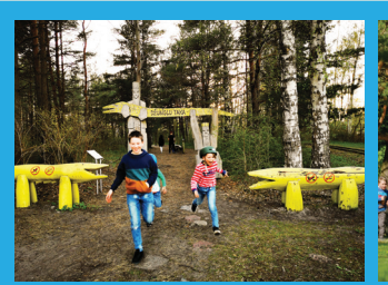
19 ТРОПА ДЖУНГЛЕЙ