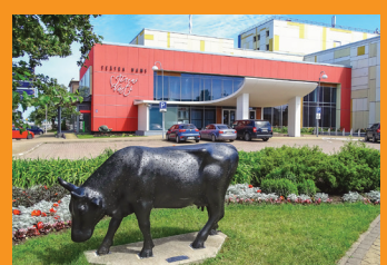
6 ДОМ ТЕАТРА «МОРСКИЕ ВОРОТА»