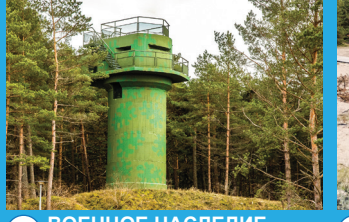
14 ВОЕННОЕ НАСЛЕДИЕ Башня коррекции наводки огня 46 - й батареи береговой обороны