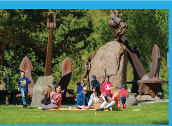
18 ПРИМОРСКИЙ ПАРК