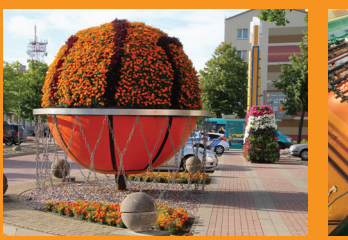
11 ЦВЕТОЧНАЯ СКУЛЬПТУРА «БАСКЕТБОЛЬНЫЙ МЯЧ» ☺ Олимпийский центр «Вентспилс»