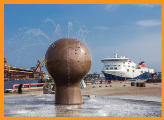
2 ФОНТАН «НАБЛЮДАТЕЛЬ ЗА КОРАБЛЯМИ»