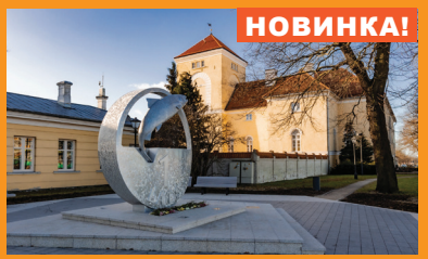
3 ЗАМОК ЛИВОНСКОГО ОРДЕНА И ОБЪЕКТ СРЕДЫ «ЛАТ»