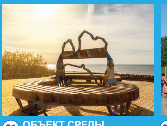
21 ОБЪЕКТ СРЕДЫ «ЗНАК КОНТУРА ЛАТВИИ»