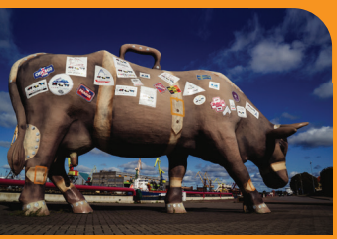
4 «КОРОВА ПУТЕШЕСТВЕННИЦА»