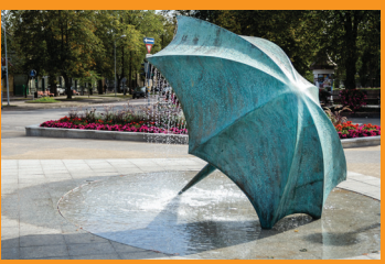
10 ФОНТАН «ЗОНТИК» ☺ Аллея Лайкраксту