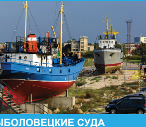
25 РЫБоловецкие СУДА «ГРОТ» И «АЗОВ»