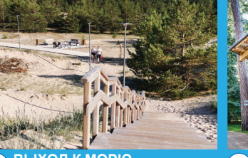
15 ВЫХОД К МОРЮ Деревянная дорожка №10 (дружественное место для выгула собак)