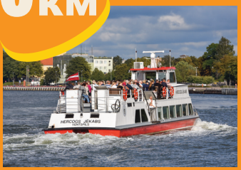
1 ЭКСКУРСИОННЫЙ КОРАБЛИК «ГЕРЦОГ ЕКАБ»