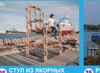
26 СТУЛ ИЗ ЯКОРНЫХ ЦЕПЕЙ