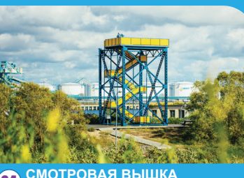
24 СМОТРОВАЯ ВЫШКА ЮЖНОГО МОЛА