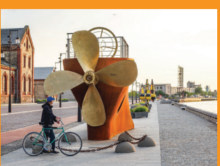
5 ПРОМЕНАД УЛИЦЫ ОСТАС