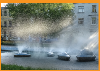
9 ФОНТАН «СОЛНЕЧНЫЕ ЛОДОЧКИ» И ЦВЕТОЧНАЯ СКУЛЬПТУРА «КОМАНДА БОБСЛЕИСТОВ» ☺ Площадь Яунпилсетас