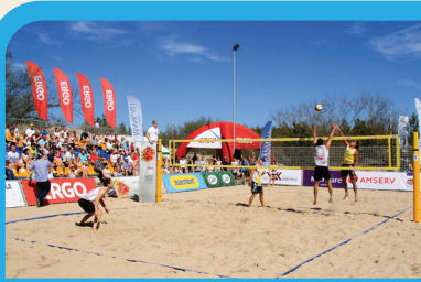
20 СТАДИОН ДЛЯ ПЛЯЖНОГО ВОЛЕЙБОЛА