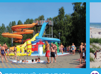
22 ПЛЯЖНЫЙ АКВАПАРК