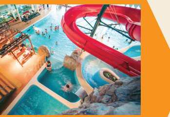
12 ПАРК ВОДНЫХ ПРИКЛЮЧЕНИЙ