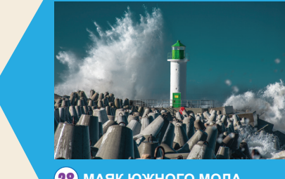
28 МАЯК ЮЖНОГО МОЛА