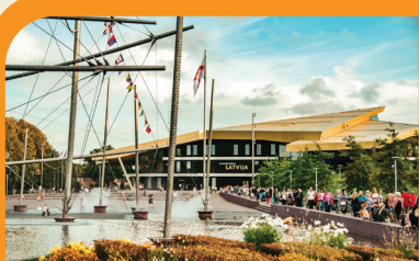
8 КОНЦЕРТНЫЙ ЗАЛ «ЛАТВИЯ» И ФОНТАН «ФРЕГАТ «КИТ»» ☺ Площадь Лиелая