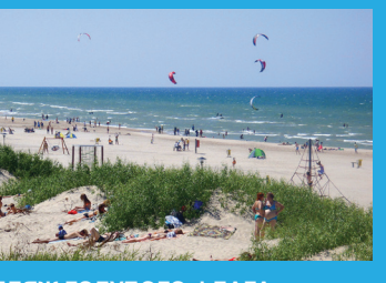
23 ПЛЯЖ ГОЛУБОГО ФЛАГА