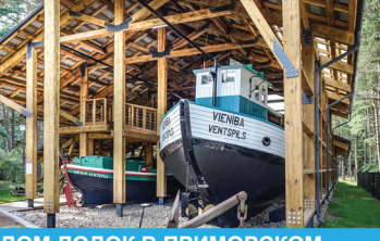
16 ДОМ ЛОДОК В ПРИМОРСКОМ МУЗЕЕ ПОД ОТКРЫТЫМ НЕБОМ ☺ Rīnka iela 2, Ventspils