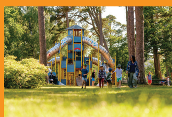
7 ДЕТСКИЙ ГОРОДОК Мероприятия по воскресеньям в 11:00