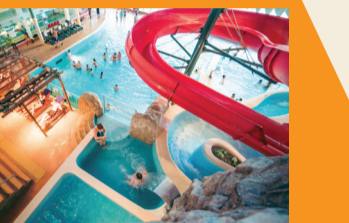
12 ŪDENS PIEDZĪVOJUMU PARKS