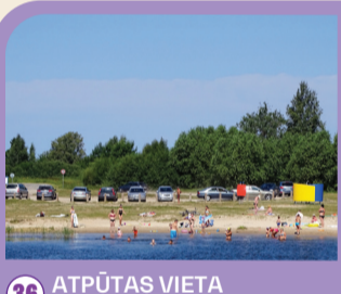
36 ATPŪTAS VIETA PIE VENTAS