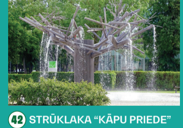
42 STRŪKLAKA "KĀPU PRIEDE"