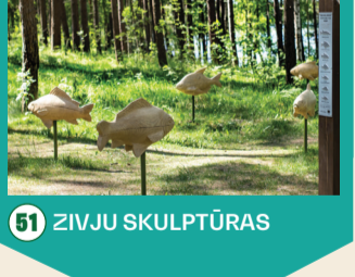
51 ZIVJU SKULPTŪRAS