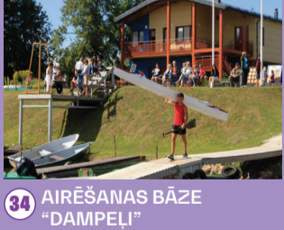
34 AIRĒŠANAS BĀZE "DAMPEĻI"