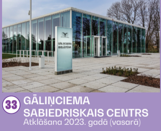
33 GĀLIŅCIEMA SABIEDRISKAIS CENTRS Atklāšana 2023. gadā (vasarā)