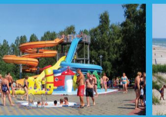
22 PLUDMALES AKVAPARKS