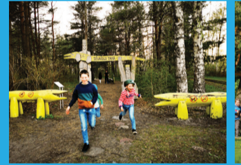
19 DŽUNĢĻU TAKA