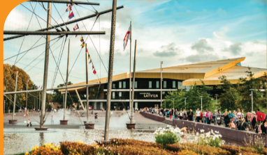
8 KONCERTZĀLE "LATVIJA" UN STRŪKLAKA "FREGATE VALZIVS" Lielais laukums