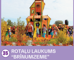
35 ROTAĻU LAUKUMS "BRĪNUMZEME"