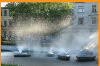
9 STRŪKLAKA "SAULES LAIVINĀS" UN ZIEDU SKULPTŪRA "BOBSLEJISTI" Jaunpilsētas laukums