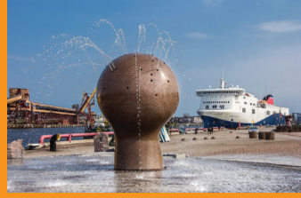
2 STRŪKLAKA "KUĢU VĒROTĀJS"