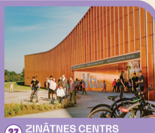
37 ZINĀTNES CENTRS "VIZIUM"