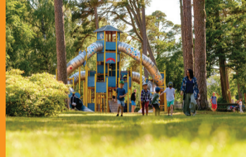
7 BĒRNU PILSĒTIŅA Pasākumi svētdienās plkst. 11.00 Laikrakstu aleja