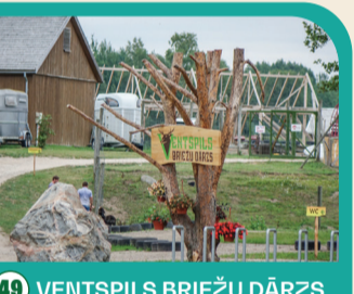
49 VENTSPILS BRIEŽU DĀRZS