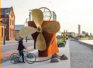
5 OSTAS IELAS PROMENĀDE