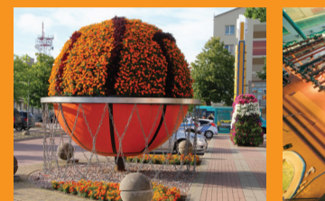
11 ZIEDU SKULPTŪRA "BASKETBOLA BUMBA" Olimpiskais centrs "Ventspils"