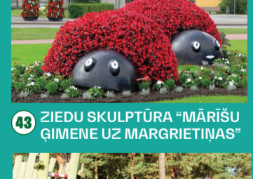
43 ZIEDU SKULPTŪRA "MĀRIŠU ĶĪMENE UZ MARGRIETIŅAS"