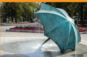
10 STRŪKLAKA "LIETUSSARGS" Laikrakstu aleja