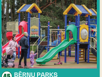
45 BĒRNU PARKS "FANTĀZIJA" Posūkumi svētdienās plkst. 15.00