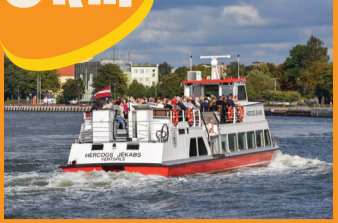
1 EKSKURSIJU KUGĪTIS "HERCOGS JĒKABS"