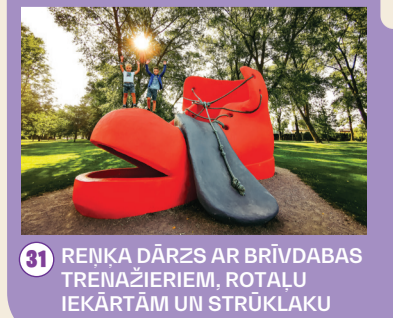
31 RENĶA DĀRZS AR BRĪVDABAS TRENAŽIERIEM, ROTAĻU IEKĀRTĀM UN STRŪKLAKU

Aplikāciju vari lejupielādēt Google Play vai App Store.