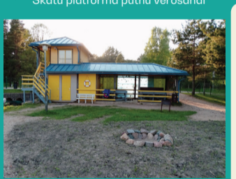
47 BŪŠNIEKU EZERA LAIVU BĀZE