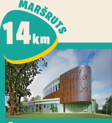
41 PĀRVENTAS BIBLIOTĒKA