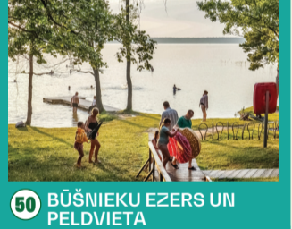
50 BŪŠNIEKU EZERS UN PELDVIETA