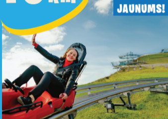
13 PIEDZĪVOJUMU PARKS UN RODEĻU TRASE