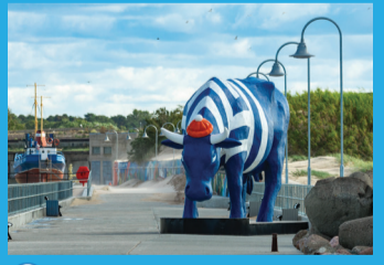
27 GOVS MATROZIS