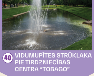
40 VIDUMUPĪTES STRŪKLAKA PIE TIRDZIECĪBAS CENTRA "TOBAGO"