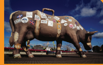
4 GOVS "CEĻOTĀJA"