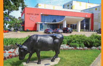
6 TEĀTRA NAMS "JŪRAS VĀRTI"