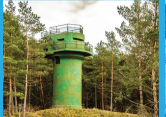
14 MILITĀRAIS MANTOJUMS 46. krasta aizsardzības baterijas uguns koriģēšanas tornis