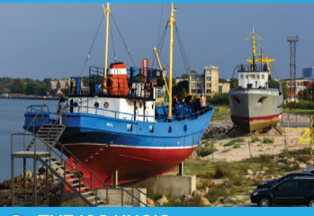
25 ZVEJAS KUGIS "GROTS" UN "AZOVA"