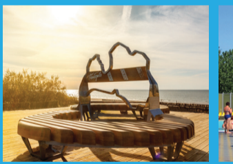
21 VIDES OBJEKTS "LATVIJAS KONTŪRZĪME"