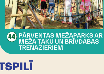
44 PĀRVENTAS MEŽPARKS AR MEŽA TAĶU UN BRĪVDABAS TRENAŽIERIEM