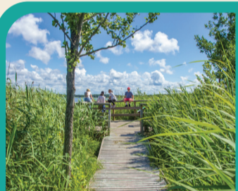
48 BŪŠNIEKU EZERS Skatu platforma putnu vērošanai