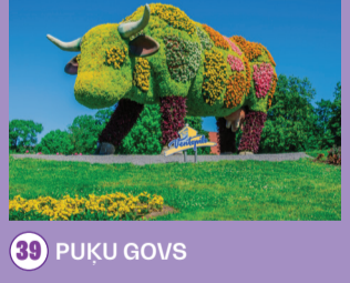
39 PUĶU GOVS