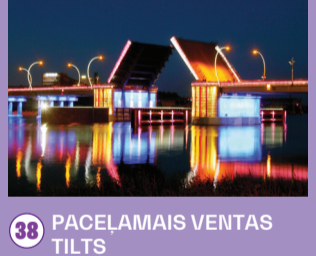
38 PACELAMĀIS VENTAS TILTS