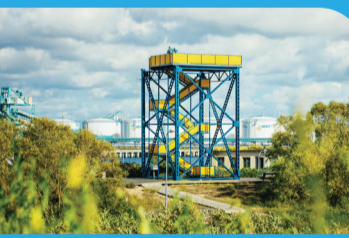
24 DIENVIDU MOLA SKATU TORNIS