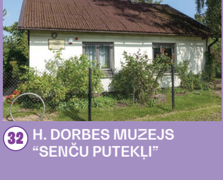
32 H. DORBES MUZEJS "SENČU PUTEKĻI"