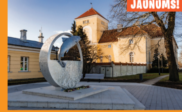
3 LIVONIJAS ORDEŅA PILS UN VIDES OBJEKTS "LATS"