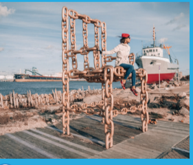
26 ĶEŽU KRĒSLS