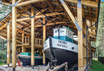
16 LAIVU MĀJA PIEJŪRAS BRĪVDABAS MUZEJĀ Rinka iela 2, Ventspils