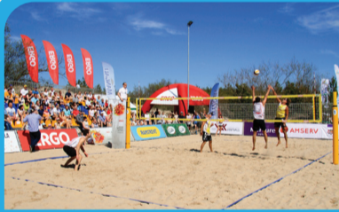
20 PLUDMALES VOLEJBOLA STADIONS