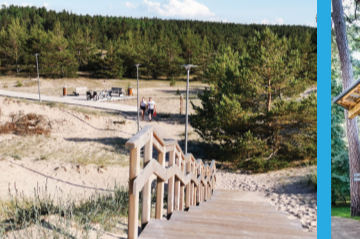
15 IEEJA UZ JŪRU 10. laipa (suniem draudzīga pastaigu vieta)