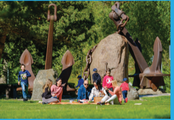
18 JŪRMALAS PARKS