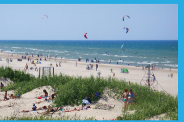
23 ZILĀ KAROGA PLUDMALE