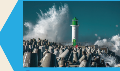
28 DIENVIDU MOLA BĀKA