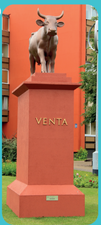
КОРОВА-КОЛОСС Автор Глеб Пантелеев